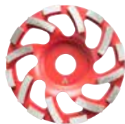
Diamantschleiftopf "abrasiv" Ø 125 mm 4100292