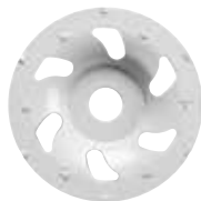
Diamantschleiftopf „PCD“ Ø 125 mm 4100293