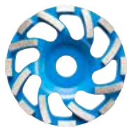
Diamantschleiftopf "Beton" Ø 125 mm 4100291

Erweitern Sie Ihren Renovierungsschleifer mit hochwertigem Zubehör für jede Anwendung. Entdecken Sie unser optionales Zubehör für GM13Y, das Sie bei jeder Schleifanwendung unterstützt.