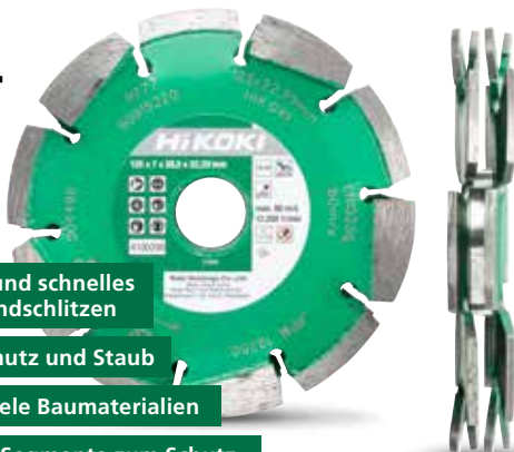
Diamant-Trennscheibe "Doppelblatt" Ø 125 mm 4100298

Komfortables und schnelles Fräsen von Wandschlitzen