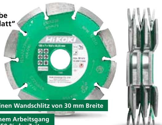
Diamant-Trennscheibe „Dreifachblatt“ Ø 125 mm 4100299

Schneidet einen Wandschlitz von 30 mm Breite