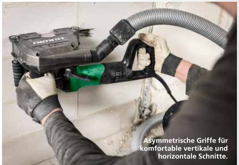
Asymmetrische Griffe für komfortable vertikale und horizontale Schnitte.